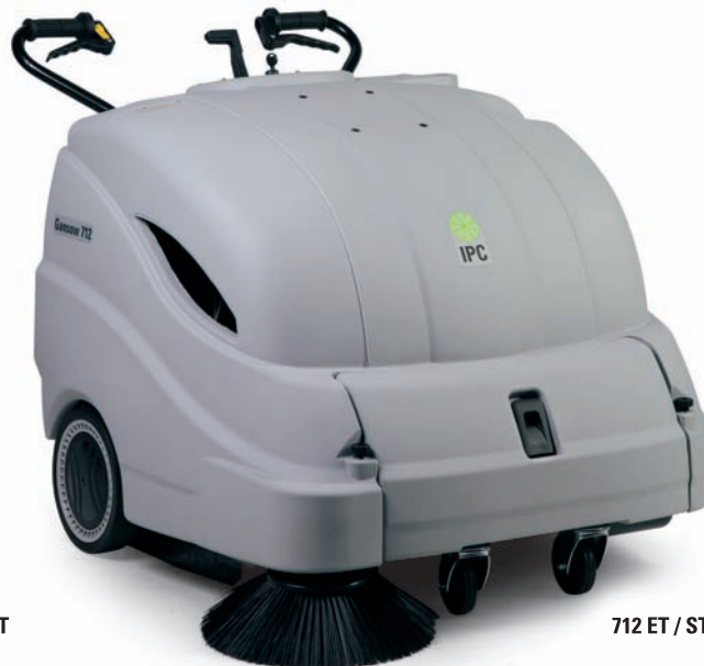
712 ET / ST