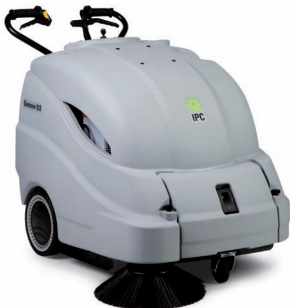
512 ET / ST