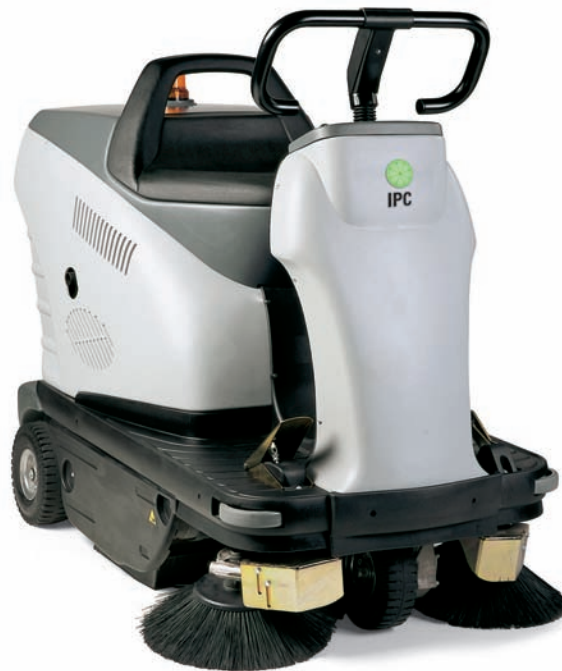
GENIUS 1050 E 2C